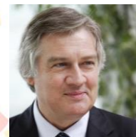
リチャード・ダッシャー スタンフォード大学 アジア・米国技術 経営研究センター所長