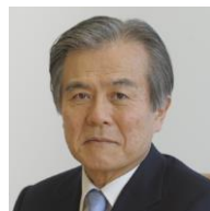
小宮山 宏 三菱総合研究所 理事長